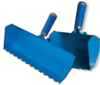
2. Назъбена лопатка - 115 mm - 175 mm - 200 mm - 240 mm