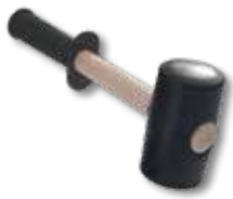
1. Гумен чук: - малък – 0.7 kg - голям – 0.9 kg