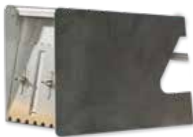
3. Кутия за лепило 115 mm 175 mm 200 mm