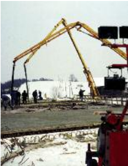
Бетониране при ниски температури.