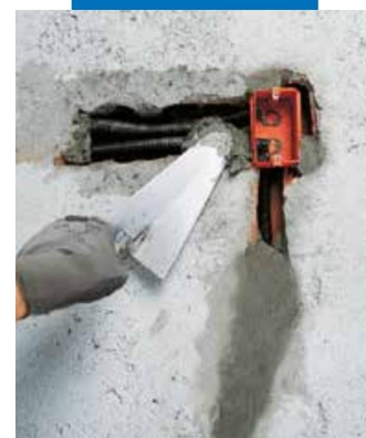
Монтиране на конзоли и тръби за електрически кабели с помощта на Латросет