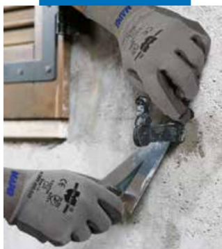
Монтиране на анкерни болтове за прозорци с помощта на Lamprocem

Оформените кухни за фиксиране трябва да се награваят и да се намокрят обилно с вода. Тази операция трябва да се извърши особено внимателно, особено ако основата е силно хигроскопична (смесена зидария, тухлена зидария) и, ако е изложена на силно слънце.