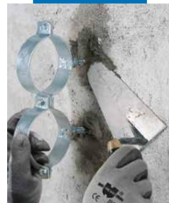
Монтиране на скоби за тръби с помощта на Латросет