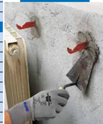
Монтиране на анкерни болтове за радиатори с помощта на Латросет